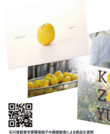
石川県能美市産国産柚子の価値創造による商品化事例

多方向の異業種連携を促し 連携先が主体的に関わることのできる 仕組みとプロダクトのデザイン